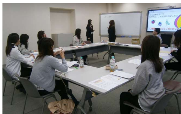
働きやすい職場づくり委員会 模様