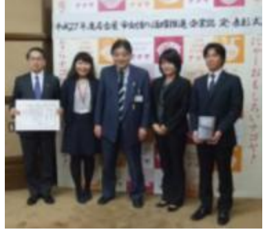
表彰式 河村市長と