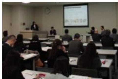
「中小企業の成長に向けた女性活躍シンポジウム」