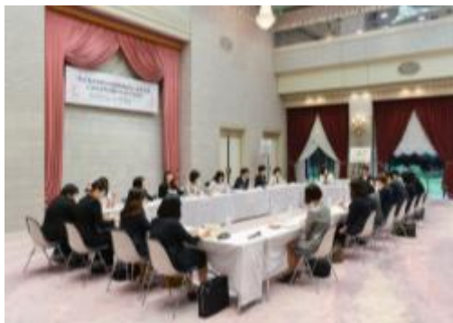
表彰企業による女性活躍のための交流会