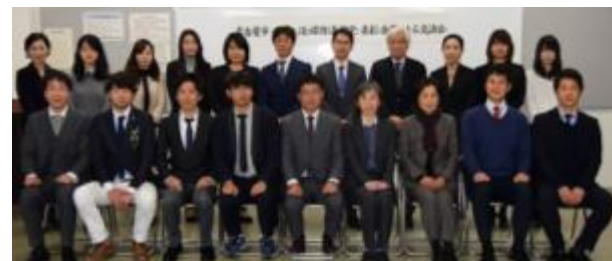
「女性活躍推進セミナー」