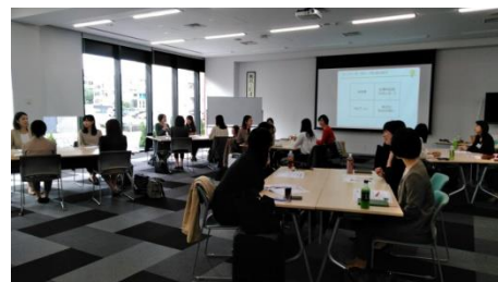
営業職向け「ポジティブキャリアサポート」