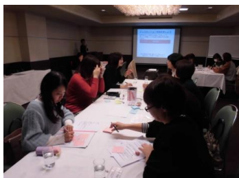
生産統括部女性社員ワークショップ