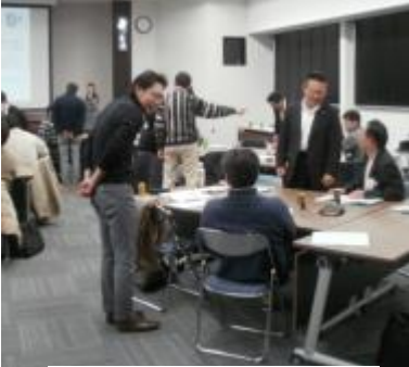
男性管理職向け研修