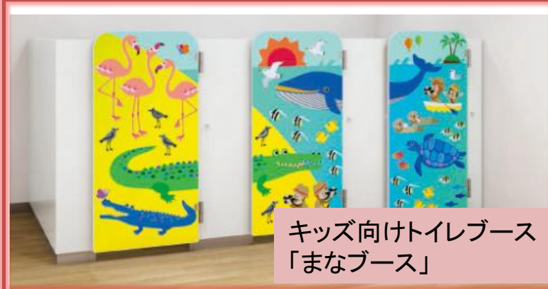
キッズ向けトイレブース 「まなブース」