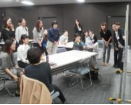
女性総合職向け研修